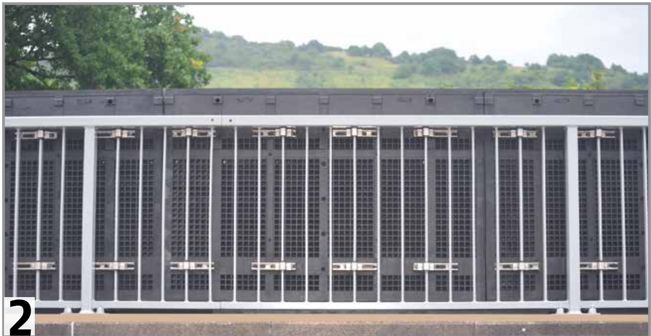
Illustration 2 : exemple d'application du système de fixation STRAILastic_IP